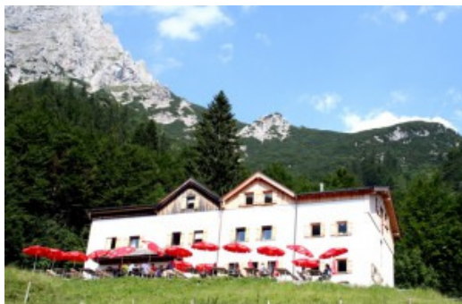
Platz 2: Gaudeamushütte am Wilden Kaiser